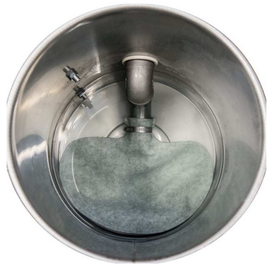
タンク内回収バッグ