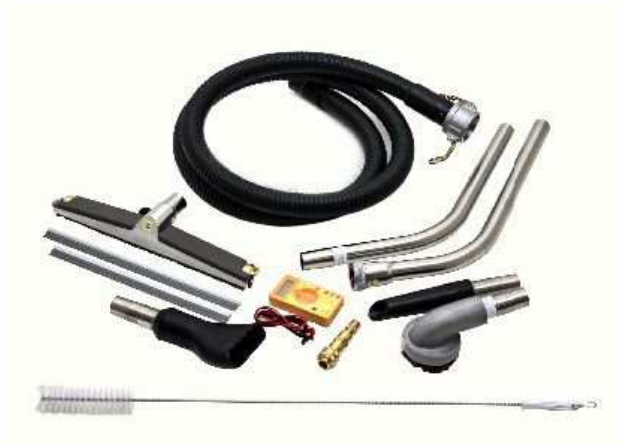
標準ツールキット