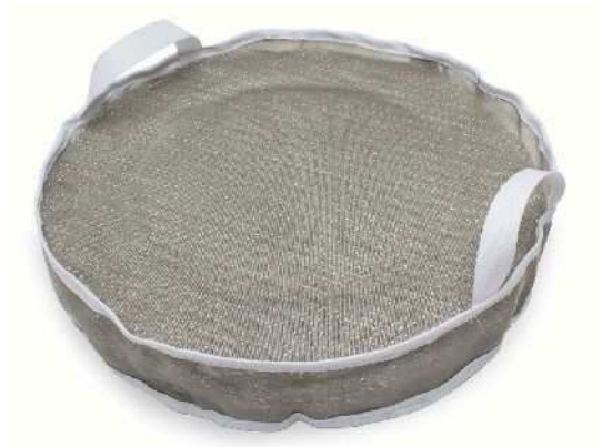
ミストアレスターパック