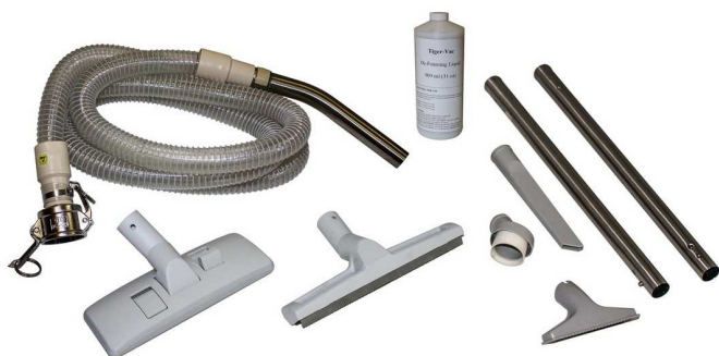
乾湿回収用ツールキット#1 (オプション)