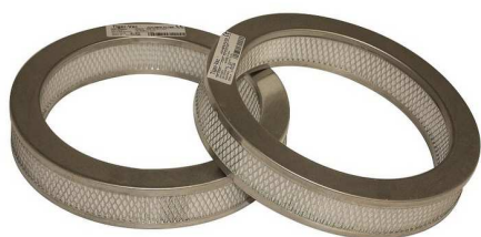
排気用ULPAフィルター