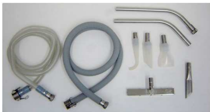
オートクレープ可能ツールキット#3 (オプション)