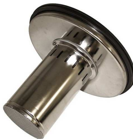
ステンレス製フロート