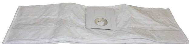
乾式用回収バッグ