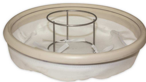
メイン布フィルターとケージ