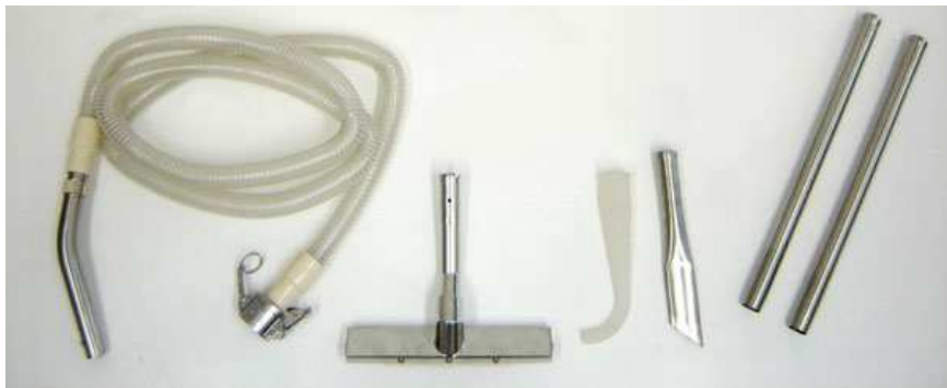
標準付属ツールキット