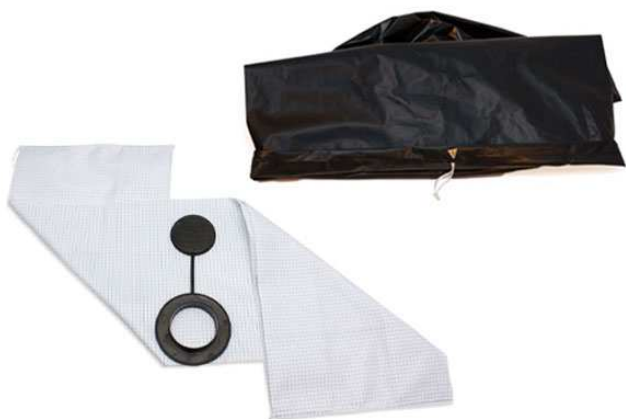
ポリライナー及び回収バッグ