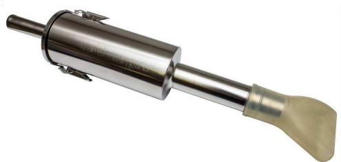
ニードルトラップ (オプション)