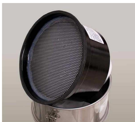
活性炭カートリッジ (オプション)

ご注意：この掃除機は爆発の危険性が常時存在しない領域 (Zone22) のみで使用可能です。