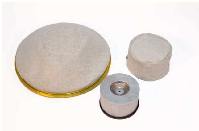
メインフィルター・HEPA フィルター