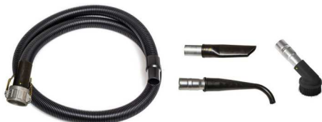
標準 3D ツール