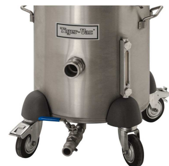
水面表示器とドレインバルブ