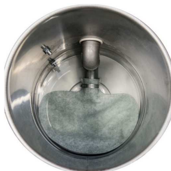
タンク内回収バッグ