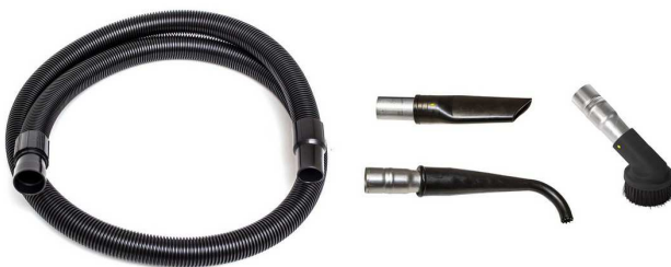
標準付属ツールキット