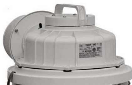
ハウジングキット