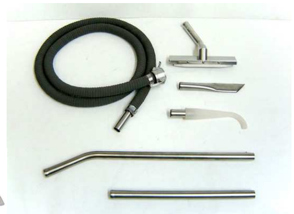
標準付属ツールキット（滅菌可）