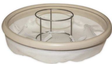
メインフィルター