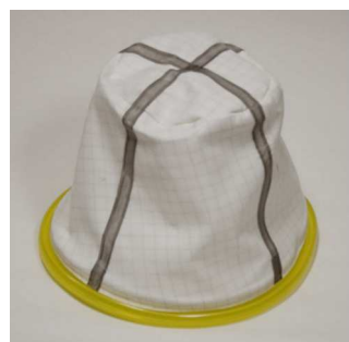
静電防止の布フィルター