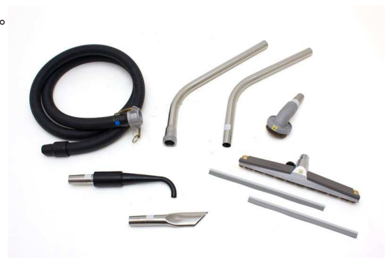
標準付属ツールセット