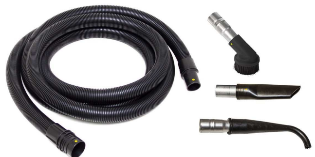
標準付属ツールキット