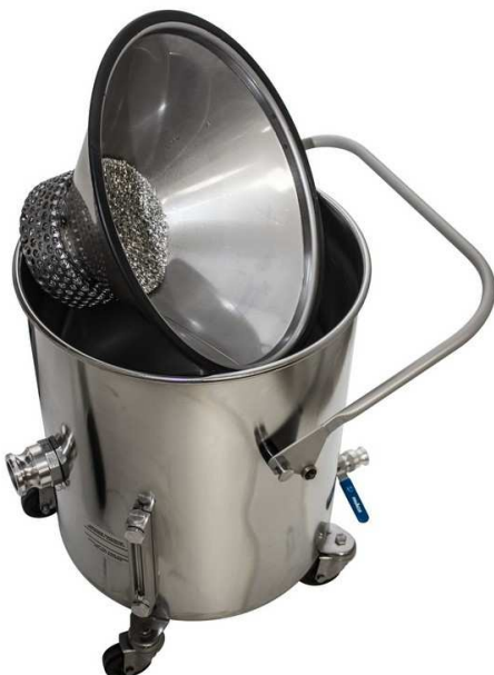
水面表示器とドレインバルブ付き回収タンク