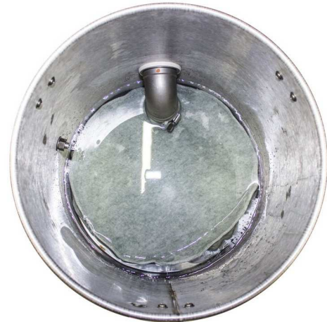
タンク内回収バッグ