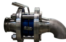
ラブチャーディスク (オプション)