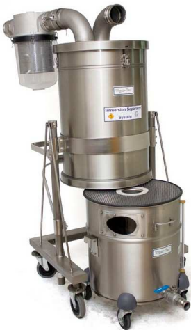
回収タンクは取り外せます