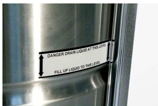
回収タンク内水面表示器