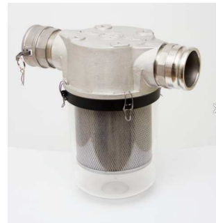
CFE HEPA フィルター