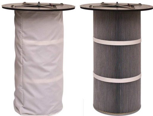
反転パージフィルターカートリッジ