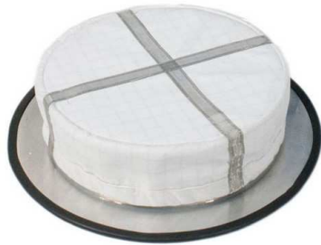
HEPA フィルター・安全フィルター