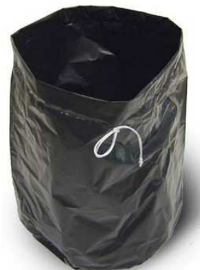
導電性ポリライナー

ご注意：この掃除機は爆発の危険性が常時存在しない領域（Zone 2 又は 22）のみで使用可能です。