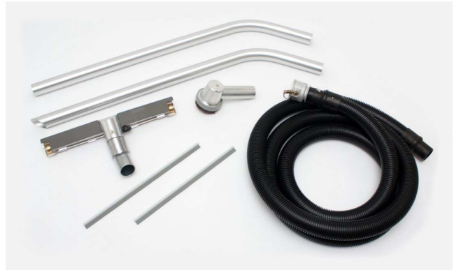
付属ツールキット