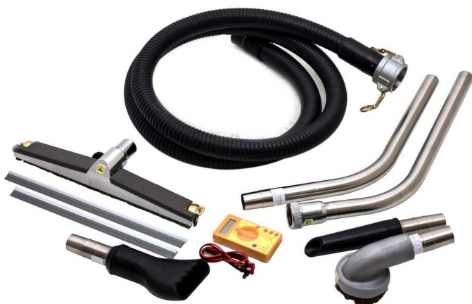
標準ツールキット