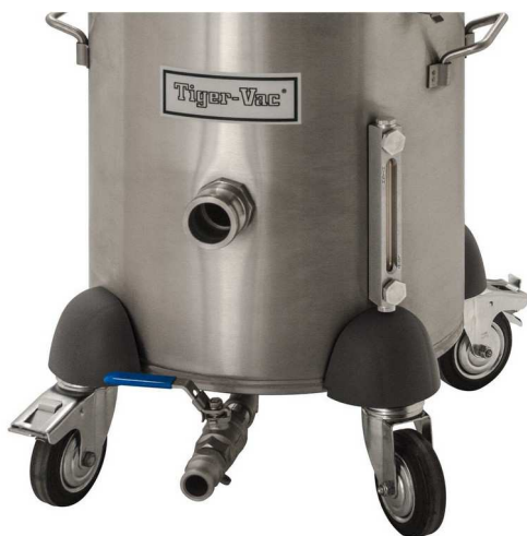
水面表示器とドレインバルブ