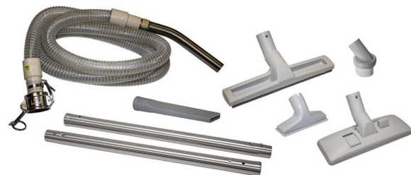
標準ツールキット

ポリエチレン回収タンク。モーター下流に ULPA フィルター（U15）が付いています。また、EMI/RFI シールドしてあり、室内のコンピューターや電子機器に影響を与えません。この機種はクリーンルーム対応で、製薬現場でもご使用になれます。汚染管理環境における一般的な清掃用にデザインされています。これは乾式・湿式回収の掃除機です。他の機種同様、出荷前に 1 台 1 台エアゾール漏れの検査をしています。