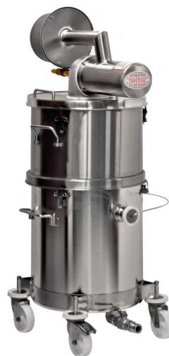
ミドルリング付属タイプ

ご注意：TigerVac 以外のツールを使用した場合や、誤った使用方法の場合、完全な防爆型にはなりません。