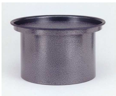
活性炭カートリッジ