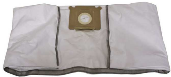
導電性回収バッグ