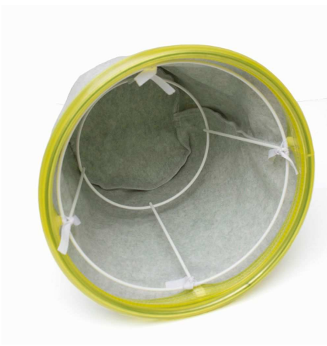
静電防止布フィルター