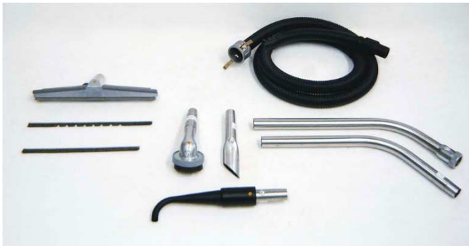
静電防止ツールキット

ご注意：TigerVac 以外のツールを使用した場合や、誤った使用方法の場合、完全な防爆型にはなりません。