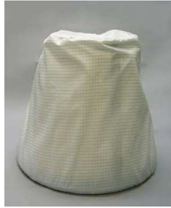
静電防止プレフィルター