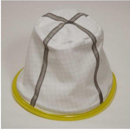
静電防止布フィルター