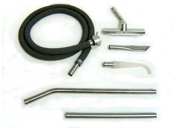
オートクレープ可能ツールキット#3（オプション）