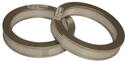
排気用 ULPA フィルター