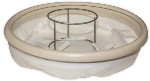
メイン布フィルターとケージ