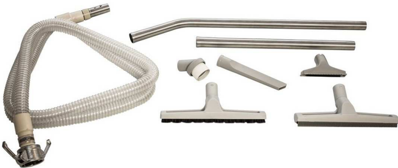
乾湿回収用標準ツールキット（オプション）