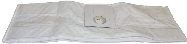
乾式用回収バッグ