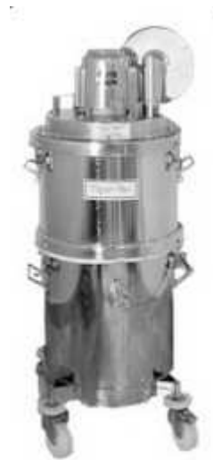
ミドルリング付属タイプ

ご注意：TigerVac 以外のツールを使用した場合や、誤った使用方法の場合、完全な防爆型にはなりません。