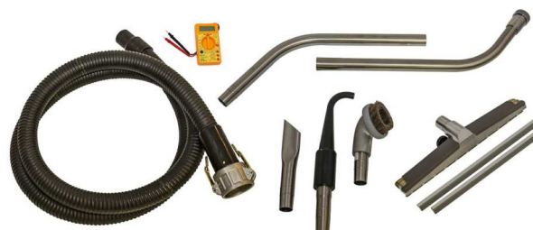
標準付属ツールセット