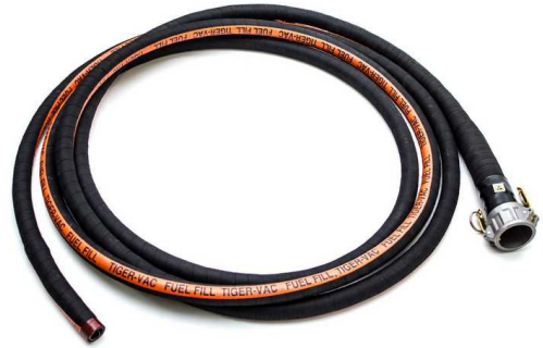
ニトリルバキュームホース