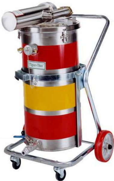
SS-25 (TC) TE