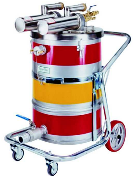
SS-55 (TC) TE TWIN

ご注意：TigerVac 以外のツールを使用した場合や、誤った使用方法の場合、完全な防爆型にはなりません。