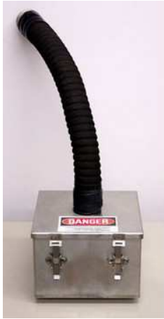
活性炭カートリッジ（オプション）