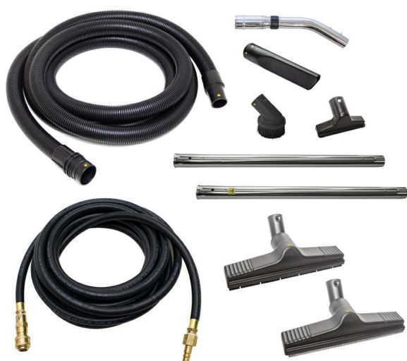
標準付属ツールキット