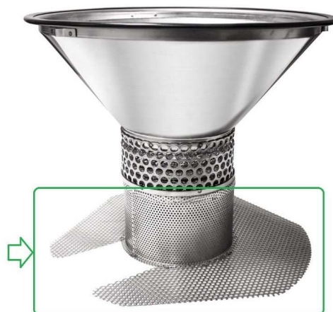
回収バッグ押さえケージ

ご注意：TigerVac 以外のツールを使用した場合や、誤った使用方法の場合、完全な防爆型にはなりません。