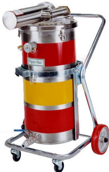
SS-25 (TC) TE