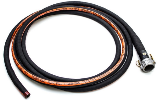
ニトリルバキュームホース