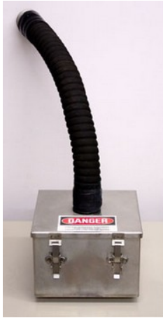
活性炭カートリッジ（オプション）