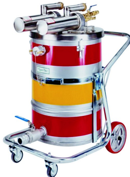
SS-55 (TC) TE TWIN