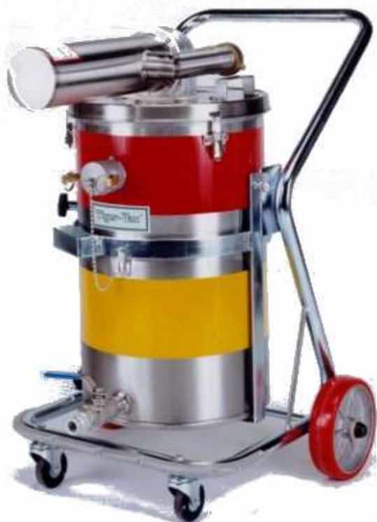
SS-15 (TC) TE

カート以外は総ステンレス構造。接地抵抗は 10Ω以下。危険な場所における清掃に使用されます。 他の機種同様、出荷前に 1 台 1 台エアソール漏れの検査をしています。