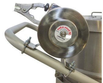
アースリール（オプション）

ご注意：TigerVac 以外のツールを使用した場合や、誤った使用方法の場合、完全な防爆型にはなりません。