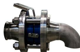
ラブチャーディスク (オプション)