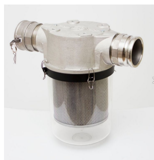
CFE HEPA フィルター