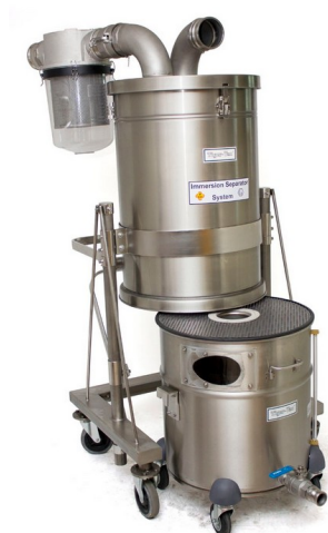
回収タンクは取り外せます