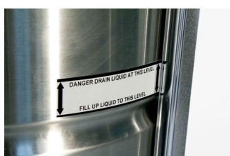
回収タンク内水面表示器